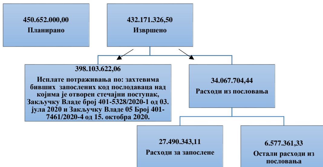
Графикон 2: Структура остварених прихода и извршених расхода у периоду 01.01.2020.– 31.12.2020.

Расходи Фонда солидарности за 2020. годину планирани су у складу са исказаним приходима у укупном износу од 450.652.000,00 динара , а остварени су у износу од 432.171.326,50 динара .